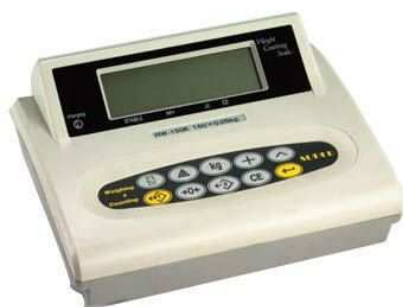
Показващо устройство HW